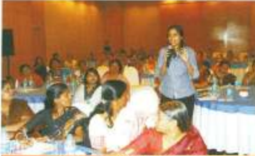
भागीदारों के साथ वार्तालाप

बैंगलोर में केनरा बैंक द्वारा राष्ट्रीय महिला आयोग के सहयोग में ‘कार्यस्थल पर महिलाओं का यौन उत्पीड़न’ विषय पर एक कार्यशाला आयोजित की गयी ।